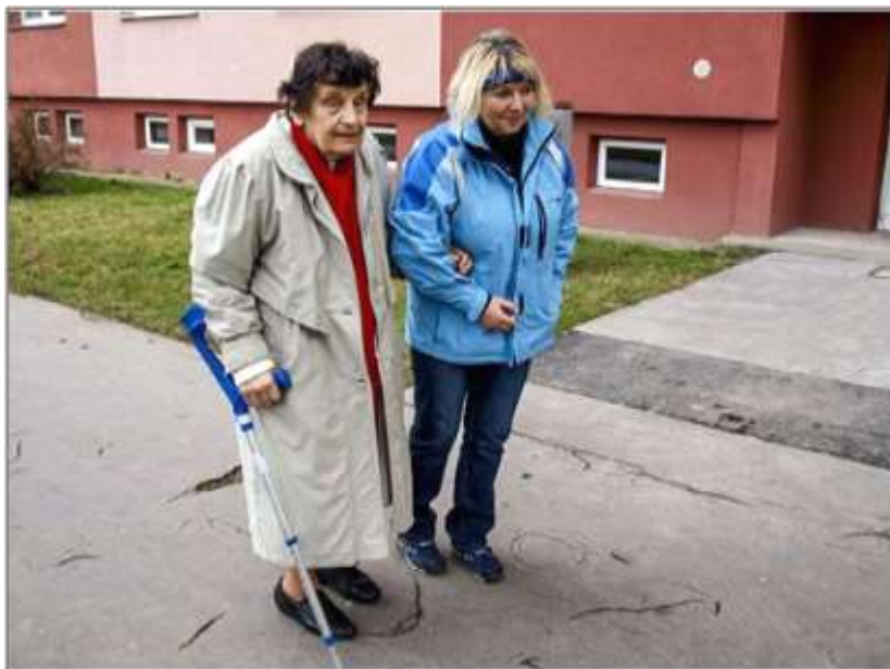
foto z asistence

Na webových stránkách města Prostějova je sdružení zařazeno v sekci Neziskové organizace. Jsme součástí informační brožury Sociální služby města Prostějova. Vydáváme vlastní časopis Infosruka, ve kterém informujeme uživatele ale i širokou veřejnost o poskytovaných službách, akcích a novinkách v sociální oblasti. Letáky a bulletiny distribuujeme do ordinací lékařů, na OSSZ, do prostějovské nemocnice a mezi širokou veřejnost. Sdružení má vytvořeny a pravidelně aktualizovány vlastní webové stránky. Z pořádaných akcí vedeme fotodokumentaci, video a audio nahrávky.