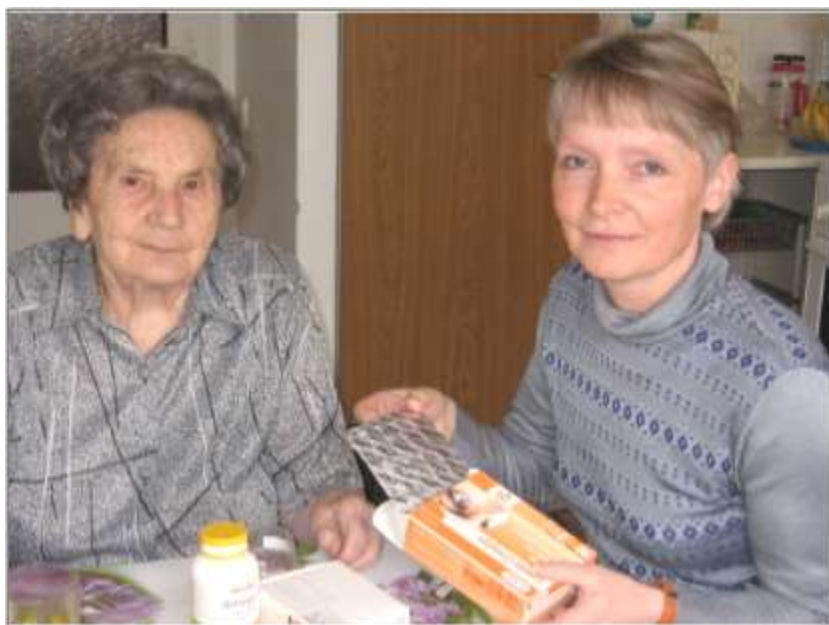
foto z asistence